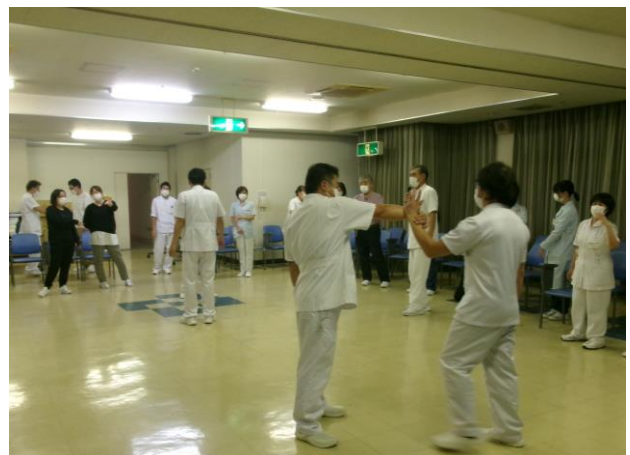
CVPPP（包括的暴力防止プログラム）院内勉強会の様子